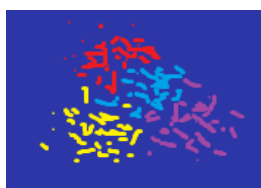
Figura 1: Cluster não hierárquico

Todavia, essa maneira de se fazer depende da possibilidade de adivinhar o número de clusters para ajustar o número deles a fim de que pontos dentro dos clusters estejam mais próximos entre suas distâncias. Nessa linha, Nils J. Nilsson exemplifica o método estatístico para agrupar dados, incluindo variações relacionadas ao método k-means , chamado de AutoClass , desenvolvido por Peter Cheeseman e seus colegas da NASA. 30 Para melhor entendimento, seguem as figuras 1 e 2.